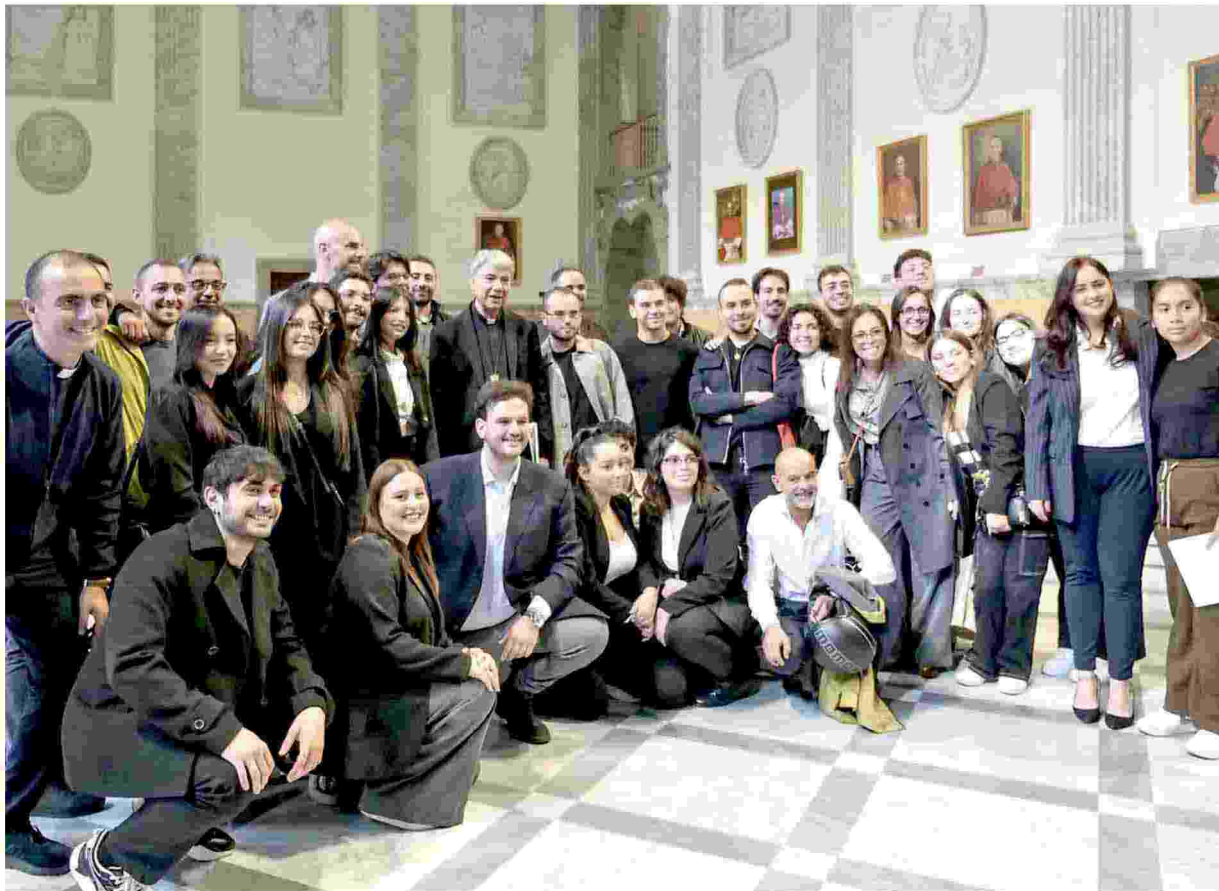
Insieme Don Mimmo Battaglia, a breve cardinale, con i giovani coinvolti nei progetti sociali

L'arcivescovo: "Facciamo rete, ripartiamo dai giovani e dai poveri"