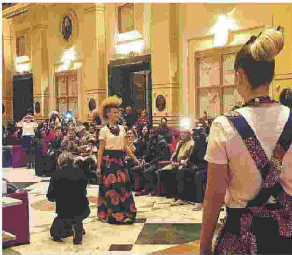
PALAZZO DOGANA Un momento della sfilata