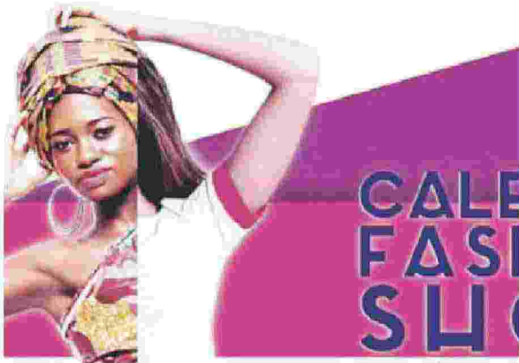
La locandina dell'iniziativa