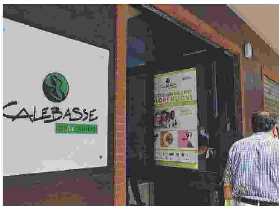
FOGGIA L'ingresso di Calebasse

trascorrere momenti di convivialità attraverso eventi, laboratori e attività interculturali». Appuntamenti a getto continuo, nella maggior parte dei giorni della settimana, si svolgono nella sala conferenze dotata di attrezzature per ospitare convegni, riunioni, assemblee, mentre intorno arredi e splendidi qua-