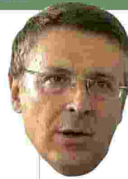
Raffaele Cantone magistrato

O riginal Marines è main sponsor della 48ª edizione del Giffoni Film Festival, creato da Claudio Gubitosi, in programma dal 20 al 28 luglio. Presentate le t-shirt realizzate dal brand campano di abbigliamento per la manifestazione. Le colorate magliette Original Marines saranno indossate dai componenti delle giurie del Giffoni Film Festival, 5601 ragazzi, dai 3 anni in su. L'azienda ha realizzato anche le maglie del team tecnico e dei masterclasses. Quest'anno il tema del Festival è Acqua : l'idea sarà resa graficamente da una ninfa, una creatura acquatica che si immerge per raggiungere gli abissi. E sarà la protagonista dell'illustrazione al centro delle magliette.