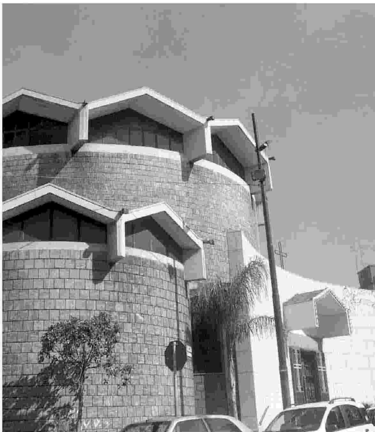
● Rione Tamburi. Chiesa San Francesco de Geronimo Il concerto degli studenti si terrà nel teatro ristrutturato della parrocchia

Il progetto finanziato dalla Fondazione con il Sud nell'ambito del bando "Ambiente è Sviluppo"