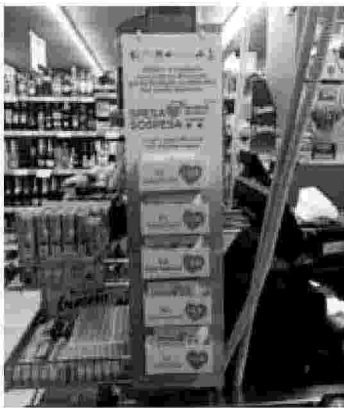
L'evento di domenica 15 luglio