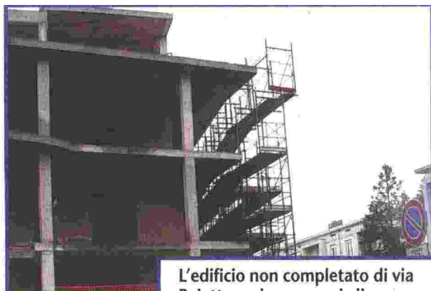
L'edificio non completato di via Paietta e due esempi di come saranno realizzati i 19 alloggi

Il tema conduttore del convegno, nei due momenti diversi in cui è articolato, sarà unico: dimostrare che grazie alla creazione di un lavoro in rete, il nostro territorio è in grado di attrarre risorse ingenti per iniziative di carattere sociale.