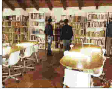
Nuovi ambienti per il sito