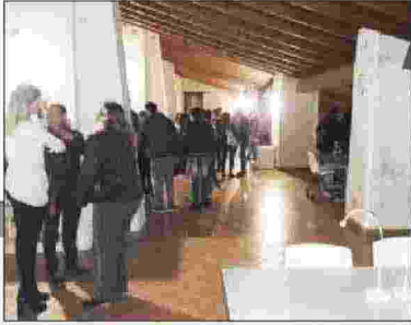
Gli interni della tonnara