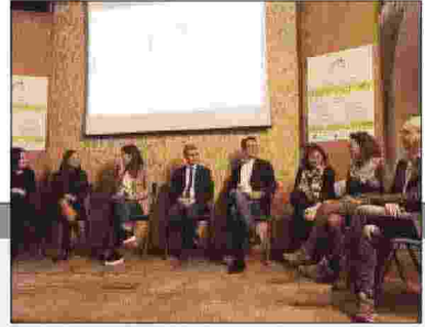
L'incontro nei locali della struttura