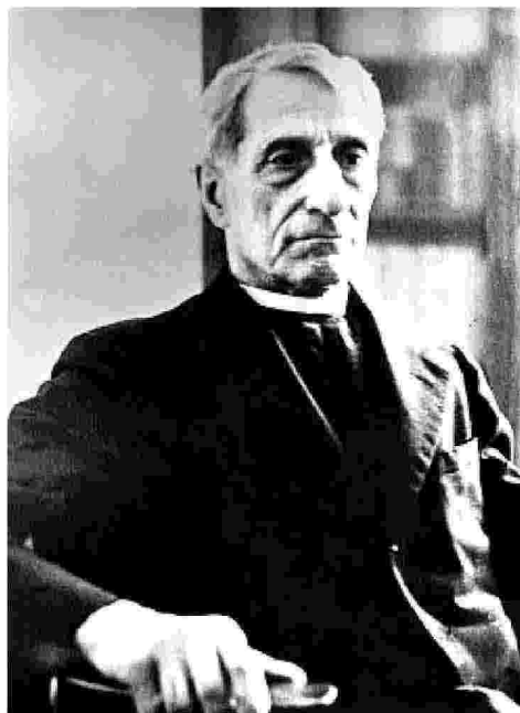
Fondatore del Partito popolare Don Luigi Sturzo