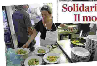
Foto d'autore Una foto storica realizzata da Nino Migliori per la copertina dell'inserto che tratta tra l'altro delle Cucine popolari (a sinistra)

Solidarietà, innovazione Il modello Bologna