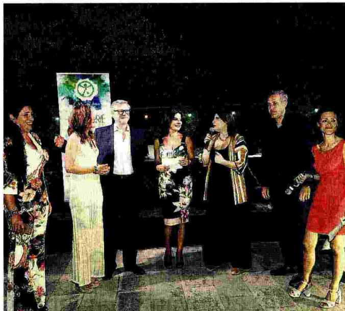
Una serata speciale, con atmosfere anni '60 L'evento organizzato nel giardino della "Gazzetta" da Nemo Sud ha attirato circa trecento persone