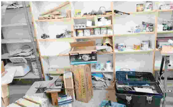
Il magazzino svuotato