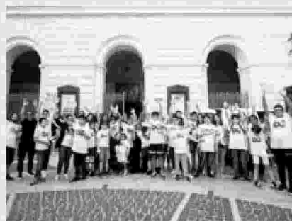
Ragazzi del gruppo iFun