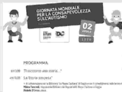
La locandina dell'evento