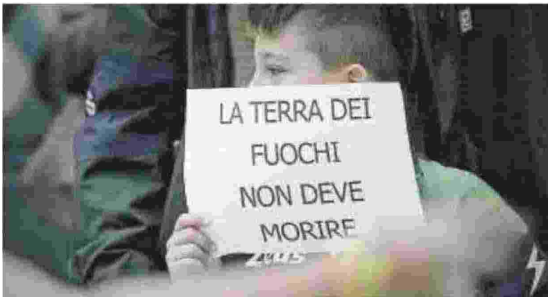
Un momento del flash mob per le vittime causate dallo sversamento di rifiuti nocivi nella Terra dei fuochi a Nord di Napoli, in una foto d'archivio del 10 novembre 2013

CIÒ CHE CONTA È CHE QUESTE RISORSE NON VENGANO SPESE PER MODELLI ASSISTENZIALISTICI E CLIENTELARI