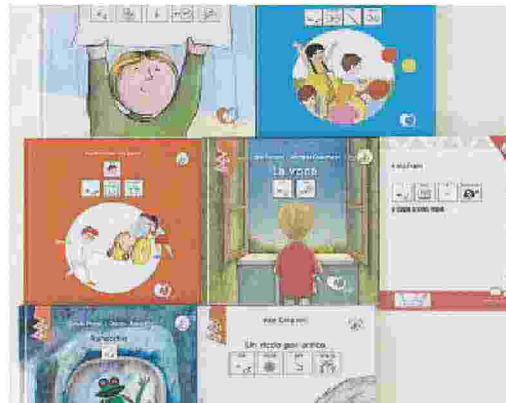
COLORI Gli «inbook» nella Biblioteca di Cavallino