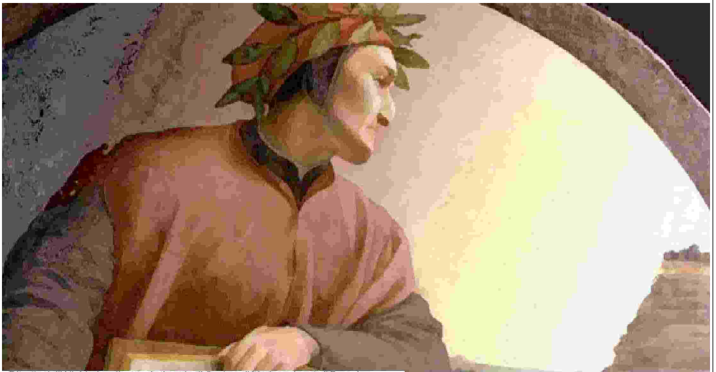
Ritratto dell'Alighieri realizzato da Agnolo di Cosimo di Mariano, in arte il Bronzino