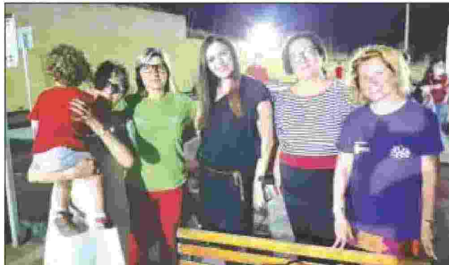
Alcuni momenti della grande festa per i tre anni del Parco "I love Calabria"