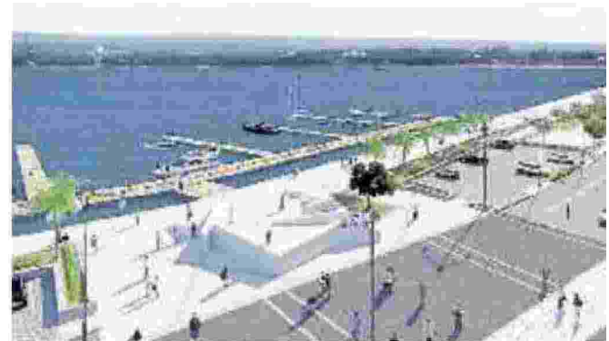
Le immagini di come sarà il litorale ristrutturato