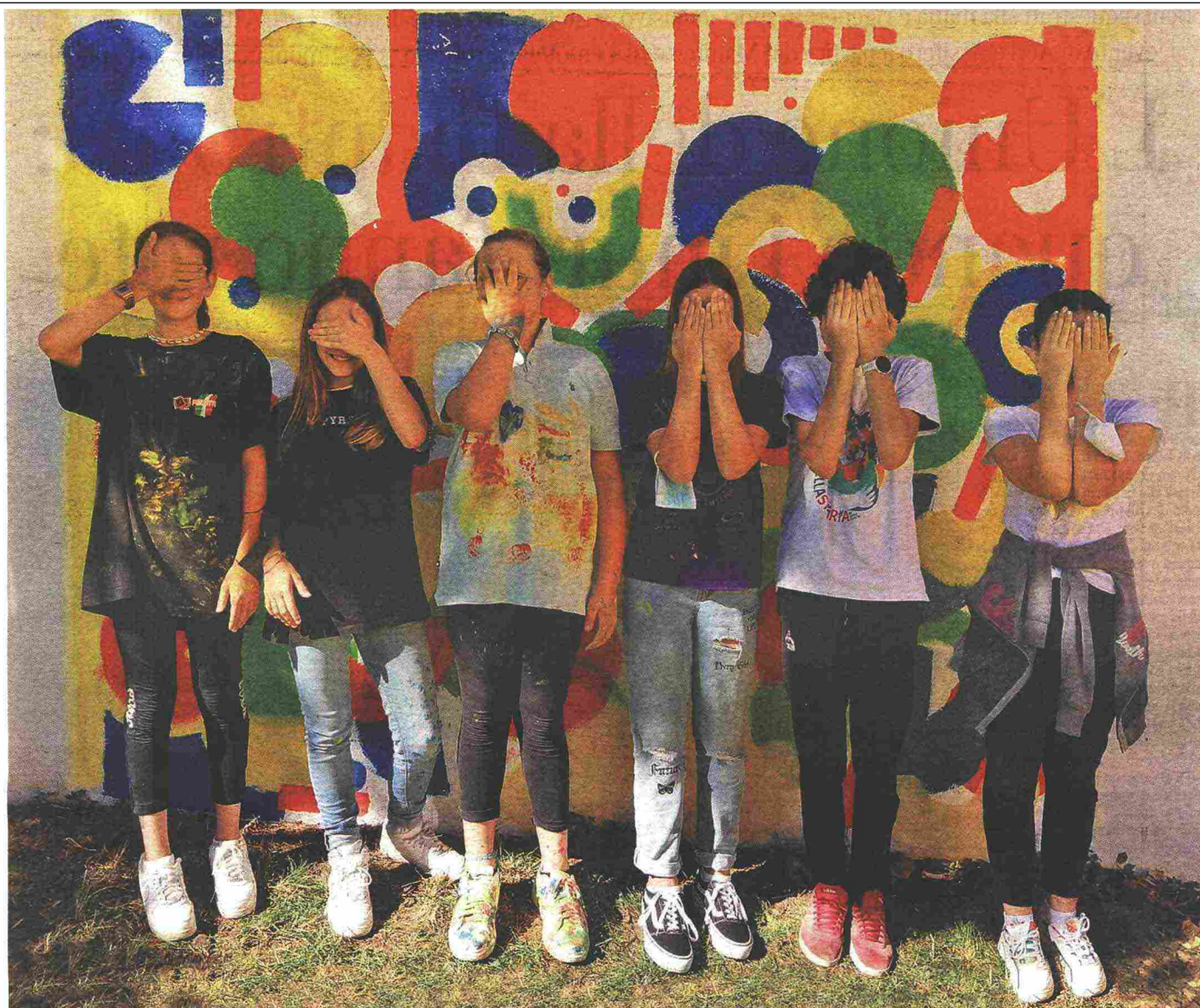
IL PROGETTO DIDATTICO DI BERGAMO