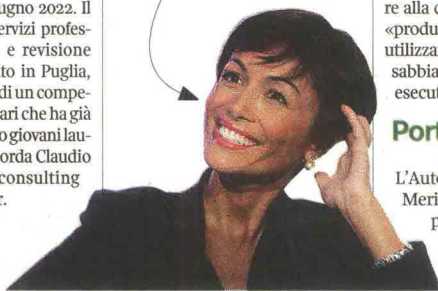
Mara Carfagna ministro del Sud

contrasto di nuove dipendenze (gioco d'azzardo patologico e nuove tecnologie) e la povertà sanitaria rafforzando i servizi sociosanitari territoriali, selezionati attraverso un bando dalla Fondazione Con il Sud , presieduta da Carlo Borgomeo .