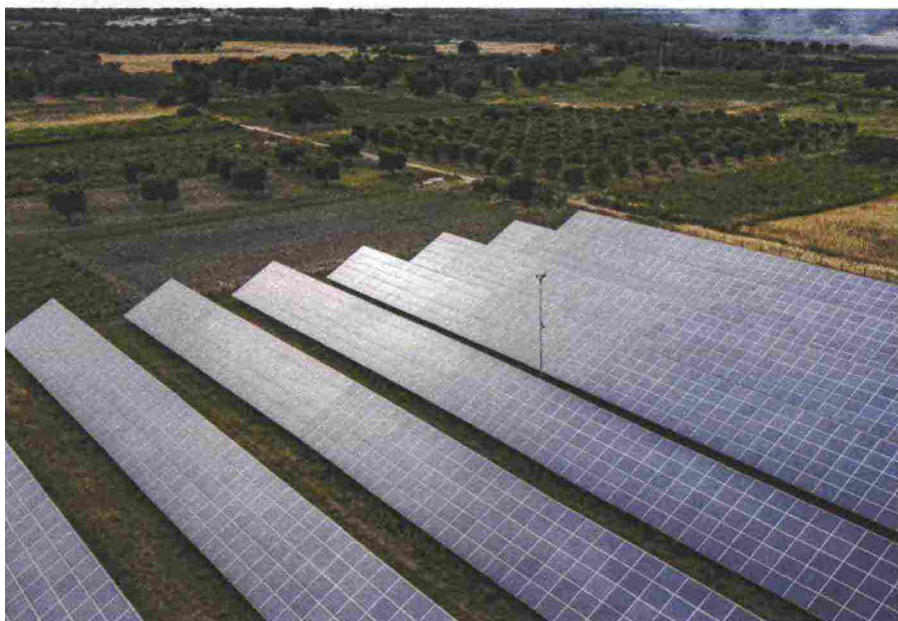
Pannelli fotovoltaici a San Pietro Vernotico, non lontano da Brindisi

realizzato un impianto solare sul tetto di una fondazione che si occupa di bambini in difficoltà, la cui energia pulita è distribuita a costo zero a una quarantina di famiglie in povertà energetica: «Rimarrà un caso isolato se il governo non avvia una strategia per coinvolgere le famiglie più povere e i quartieri dove più si soffre la crisi», dice Zanchini, che continua: «Le comunità energetiche in teoria godono di incentivi pubblici e il Pnrr prevede un fondo di garanzia da 2,2 miliardi per i prestiti ai comuni fino a cinquemila abitanti proprio per dare vita a nuove comunità energetiche. Ma l'assenza di una cabina di regia non favorisce l'uso di questo strumento nei quartieri più poveri. Il rischio è che proprio nelle periferie più difficili le comunità non si possano realizzare perché le banche non prestano i soldi necessari a partire, mentre in condomini di quartieri ricchi partano, aumentando ulteriormente la disuguaglianza. Sarebbe davvero un grosso sbaglio, perché le comunità energetiche sono una straordinaria opportunità per aggredire la povertà energetica e affrontare in modo concreto la situazione di emergenza che stiamo vivendo».