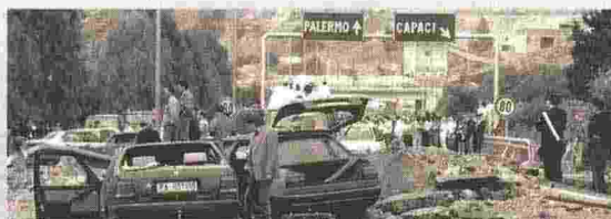
L'attentato L'autostrada sventrata dal tritolo nella strage di Capaci in cui morì Giovanni Falcone il 23 maggio 1992