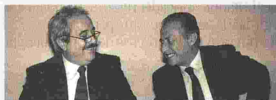
Insieme Giovanni Falcone, ucciso dalla mafia il 23 maggio 1992, con Paolo Borsellino, assassinato il 19 luglio dello stesso anno