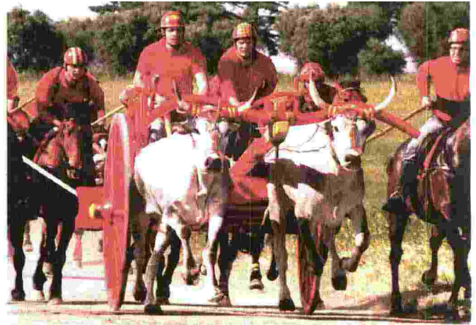
La Corsa dei carri