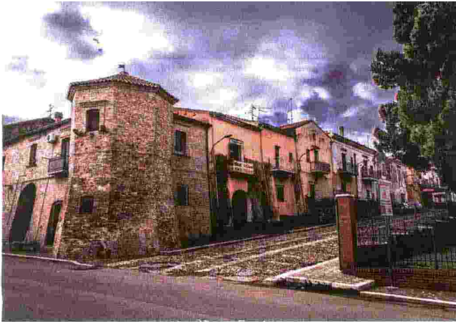
Scorcio di Chieuti