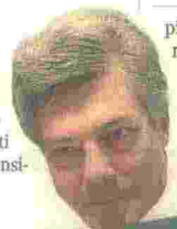
Ferruccio Ferranti Mediocredito centrale

Via libera della Regione Puglia al progetto di Act Blade per far sorgere nel porto di Brindisi, in area Zes, una fabbrica di pale eoliche ultraleggere. Previsti un investimento di 14 milioni e la creazione di 169 posti di lavoro. Nel progetto investirà, tramite il fondo Far Evolution, Orienta Capital Partner, società specializzata negli investimenti in piccole aziende dall'elevato potenziale di crescita.