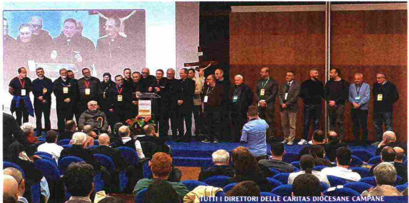
TUTTI I DIRETTORI DELLE CARITAS DIOCESANE CAMPANE