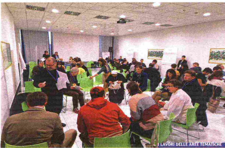
LAVORI DELLE AREE TEMATICHE