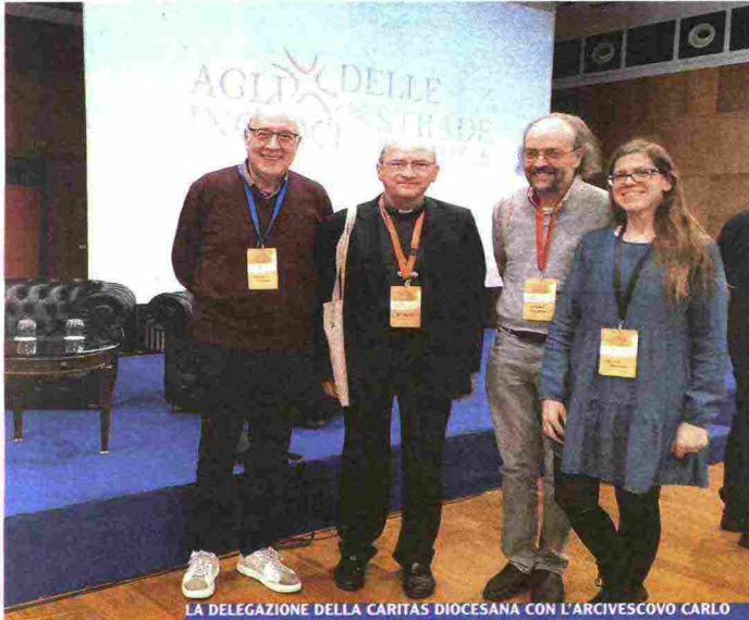
LA DELEGAZIONE DELLA CARITAS DIOCESANA CON L'ARCIVESCOVO CARLO