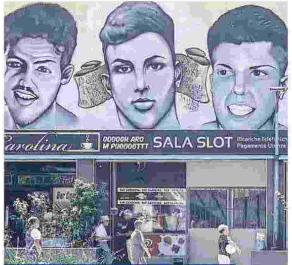
GLI SCATTI A sinistra la piscina abusiva in un'aiuola al centro del quartiere, accanto una veduta della via principale