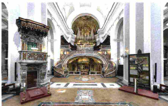
Basilica di Santa Maria della Sanità con l'ingresso alla catacomba di San Gaudioso

Tale modello, sebbene non codificato al punto tale da poter essere esportato in maniera non differente in altri contesti, ha tuttavia tracciato un solco significativo entro il quale inserire altre sperimentazioni italiane. Tra queste il Museo dei Sensi di Sciacca, in Sicilia, dove il progetto di un museo su scala urbana nasce dalla analoga convinzione che le comunità siano le principali eredi della bellezza dei luoghi, e il sito della Piscina Mirabilis , a Bacoli, di cui La Paranza è uno dei partner a cui è stata affidata la gestione. ■