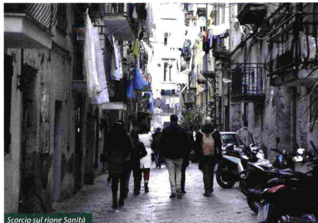
Scorcio sul rione Sanità

Il processo di 'autopoiesi' e rigenerazione urbana, che la cooperativa sostiene ormai da anni con successo, non ha mancato di dar luogo a riflessioni di natura teorica in merito alla capacità dei territori, e nello specifico delle aree urbane degradate, di rigenerarsi. Il processo ha infatti permesso l'elaborazione di un approccio nel quale emergono chiare alcu-