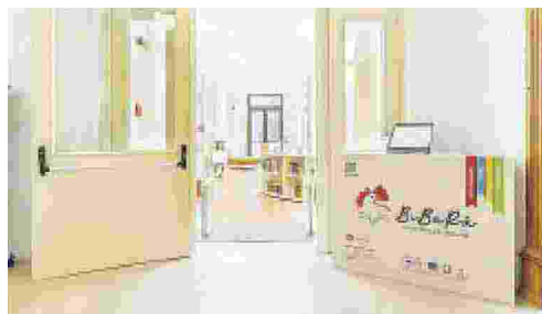
NUOVI SERVIZI La biblioteca comunale di Rutigliano