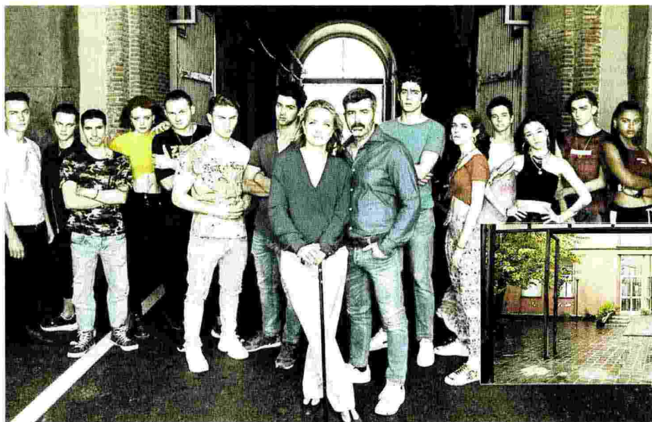
CAST Gli attori della quarta stagione di Mare Fuori. Nel riquadro: la biblioteca "Grazia Deledda" di Ponticelli che verrà ristrutturata dalla Picomedia che produce la serie

OPERAI IN AZIONE TRA UNA SETTIMANA NUOVI IMPIANTI TETTO IMPERMEABILE E ILLUMINAZIONE PER LE AREE ESTERNE