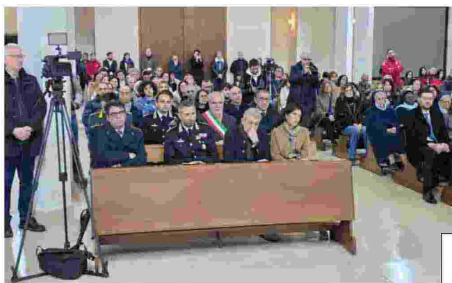
Gli intervenuti alla funzione a Casale