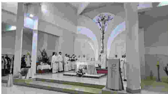
La celebrazione della messa in memoria di don Peppe Diana