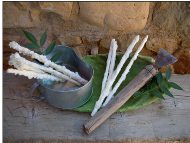
La manna di Castelbuono