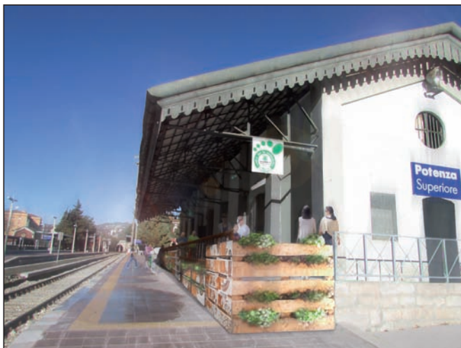
La bottega "Costruiamo Saperi", che ospita eventi interculturali