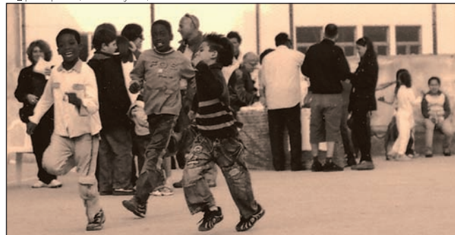
Sud_Spread Experiences, foto di M. Gangarossa, Palermo

E POI? Testimonianze del "dopo" progetti