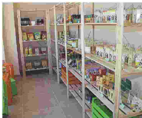
FOGGIA Il Market di Calebasse