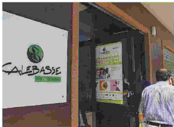
FOGGIA L'ingresso di Calebasse