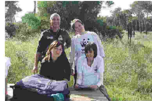
BELLA NATURA A sinistra operatori di Palude La Vela (in basso lo scenario naturalistico); in basso un particolare rupestre di «Monte Sant'Elia» nel tarantino