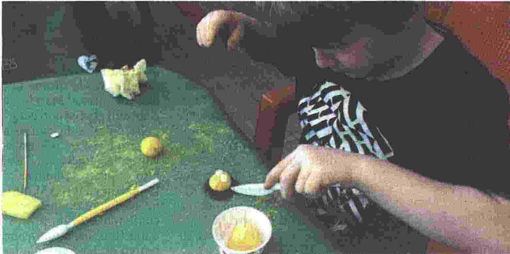
■ Un bambino costruisce un regalo per la mamma al Bioparco