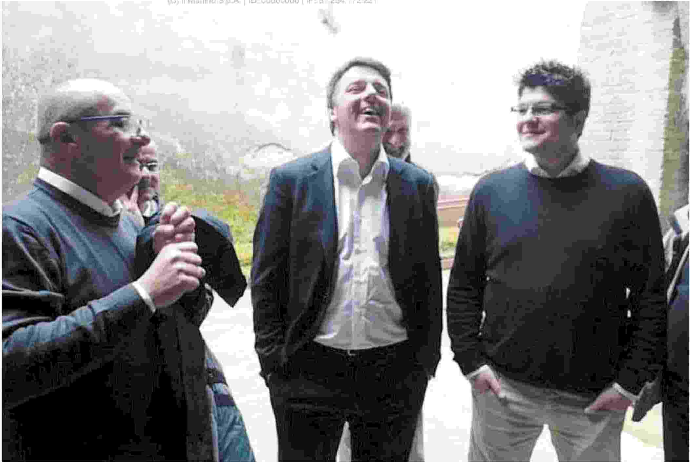
Alla Sanità Matteo Renzi con don Antonio Loffredo parroco del rione Sanità durante una recente visita al quartiere. In basso un'immagine delle Olimpiadi di Barcellona

(G) Il Mattino S.p.A. | ID: 00000000 | IP: 67.254.172.221