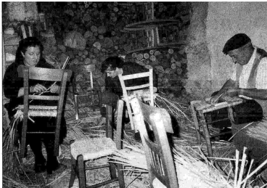
Fino al 20 febbraio, presso la Casina del Principe di Avellino, c'è la mostra "Mestieri domani"

Presso il Teatro Gesualdo. Claudia Gerini con il suo personale omaggio alle grandi donne che sono state di rottura e d'innovazione nel mondo delle arti e che hanno contribuito a creare la sensibilità artistica dell'attrice romana. Accompagnata sul palco da un corpo di ballo e da un gruppo musicale dal vivo, la Gerini racconta storie che intrecciano momenti e personaggi biografici ad altri di pura fantasia